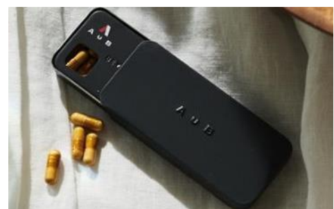
定期の初回購入時は、スタイリッシュな専用ケース付き

その知見を生かして、酪酸菌をメインに、29 種類の菌を配合した独自の「アスリート菌ミックス」を開発。同菌ミックスをベースとしたサプリメントが「AuB BASE(オーブ ベース)」です。腸内環境を整える“腸活サプリ”として発売します。