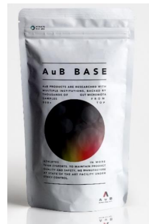
理想の腸内環境へ… “美肌効果”も期待！

今後はトレーニンギジムとの提携など自社オンラインショップ以外の販売チャネルを増やすほか、「アスリート菌ミックス」を使ったシリーズ商品の開発でラインアップを増やします。そうして今後1年以内に、シリーズを含む定期購入者数を、現在の4倍に当たる4000人に引き上げる目標です。