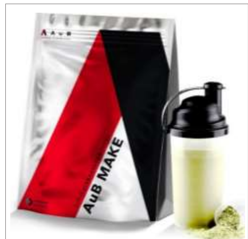
免疫力をコントロールする、いま注目の酪酸菌をメインに、乳酸菌・ビフィズス菌など29種の多様な菌を配合した、“腸活プロテイン”!

価格(送料別)は定期購入で税込 7,549 円(初回特典:価格 5,389 円、シェイカー付)です。単体価格は同 8,629 円です。年間 1 万個の販売を目指します。