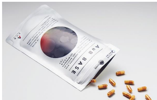
理想の腸内環境へ…“美肌づくり”も期待!

送料無料後の価格は、定期購入で税込 5378 円(初回特典:税込価格 3218 円、専用ケース付)です。単体価格はこれまで通り、送料込みで同 6578 円(沖縄と離島は送料の追加費用有)です。