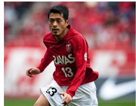
写真は 2009 年の J1 公式戦の様子

2000 年のレッズ加入から 2015 年シーズンの引退まで 16 年間、浦和レッズ一筋で現役生活を送った鈴木として、約 5 年ぶりの“帰還”となりました。